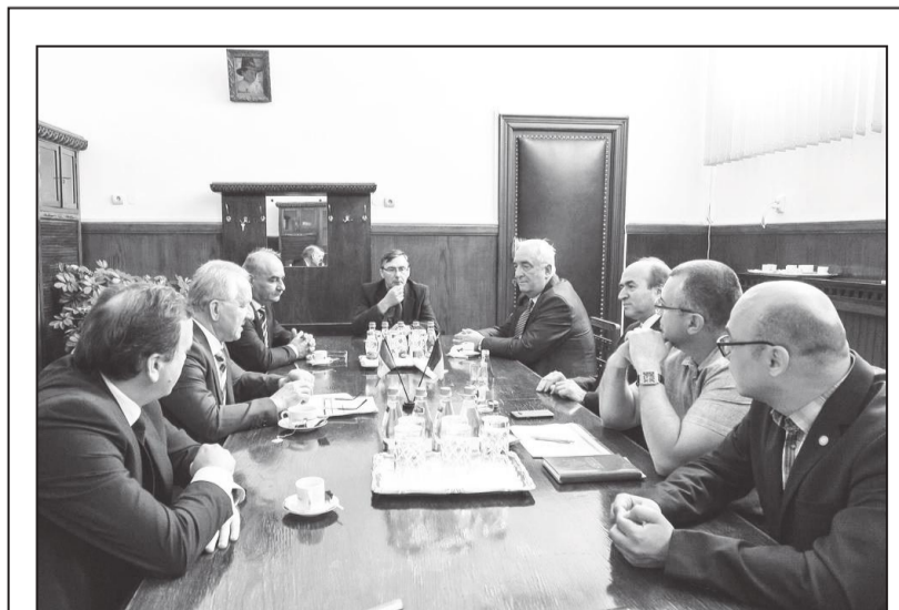
Universitatea „Alexandru Ioan Cuza” din Iași și Universitatea de Stat „Alec Russo” din Bălți au semnat la 8 iulie 2016 un nou acord de colaborare pe o perioadă nedeterminată care prevede stabilirea noilor direcții de cooperare în domeniul didactic, cel al cercetării științifice și al relațiilor internaționale.

– Cred că cele expuse anterior pot servi ca argument pentru tinerii din nordul republicii și nu numai de a veni la studii la Universitatea „Alec Russo” – instituție unde se pregătesc specialiști în corespundere cu standardele europene și cerințele pieței muncii. Sloganul activității noastre de instruire și formare profesională rămâne neschimbat: „Studentul este figura centrală în universitate!” Nu-mi rămâne decât să le spun: Sunteți bineveniți la Universitatea de Stat „Alec Russo” din Bălți, unde veți întâlni profesori buni și o comunitate studentă solidă și prietenoasă!